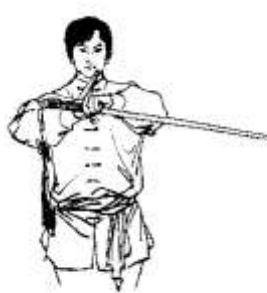
Pozdrav s mečom