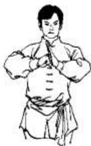
Pozdrav päst' - dlaň

V stojacej pozícii s nohami spolu a oboma rukami zohnutými v lakti vpredu pred hrud'ou, držiak kopiju alebo palicu vzpriamene v pravej ruke v jednej tretine dĺžky od konca, zatiaľ čo ľavá dlaň sa dotýka pravého palca. Ruky sú 20-30cm vpredu od hrude.