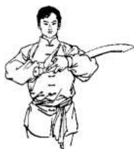
Pozdrav so šabl'ou